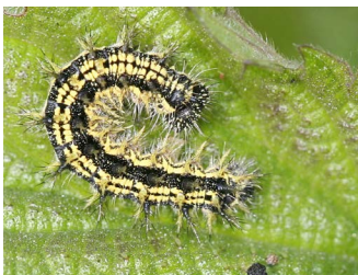
Raupe Kleiner Fuchs